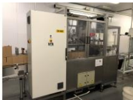
Referencia: PGM-012 ENCAJADORA TECMA PACK Año: 1997 Marca: TECMA PACK