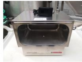
Referencia: LFR-041 DESINFECTADOR PARA PEQUEÑOS UTILES Año: . Marca: NICOMAC