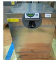
Referencia: LFR-030 LAVADORA, SECADORA DE CRISTALERIA Año: . Marca: LANCER