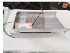
Referencia: LFR-036 VIBRADOR DOSIFICADOR Año: 2014 Marca: ENDRES