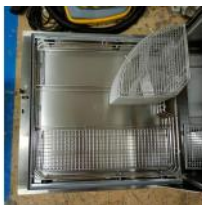
Referencia: LFR-091 LAVADORA, SECADORA DE CRISTALERIA Año: . Marca: LANCER