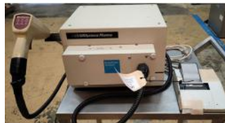
Referencia: LFR-039 ANALIZADOR NIRS Año: . Marca: NIRS