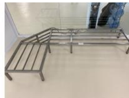
Referencia: LFR-076 PLATAFORMA INOX Año: . Marca: .