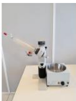
Referencia: LFR-040 ROTOVAPOR Año: . Marca: BIBBY STERILIN