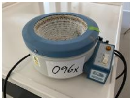
Referencia: LFR-096 CALEFACTOR PARA MATRACES Año: . Marca: JP SELECTA