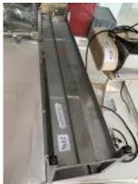
Referencia: LFR-084 BANCO DE VESTUARIO Año: . Marca: .