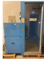
Referencia: LFR-008 CABINA DE DUCHA DE AIRE Año: 2001 Marca: MUNDER