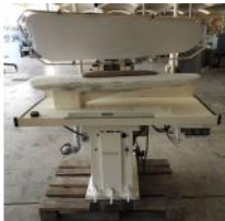
Referencia: TWD-001 PLANCHA INDUSTRIAL Año: . Marca: PANTEX