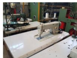
Referencia: BOR-016 MAQUINA COSER BROTHER DE 2 HILOS Año: . Marca: BROTHER