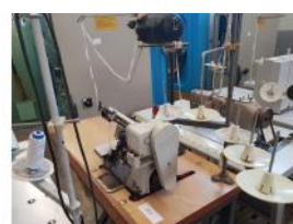
Referencia: BOR-007 MAQUINA COSER FANDOS BROTHER Año: . Marca: FANDOS BROTHER