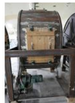
Referencia: CGR-053 BOMBO PARA CURTIDOS DE PIELES Año: . Marca: VENTURA