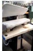
Referencia: CUM-024 PLANCHA INDUSTRIAL Año: . Marca: PANTEX