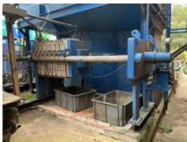
Referencia: CGR-054 PRENSA Año: . Marca: TEFSA