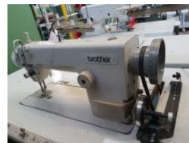
Referencia: BOR-012 MAQUINA COSER BROTHER Año: . Marca: BROTHER