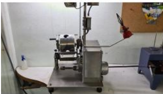
Referencia: JSO-008 TRANSCANADORA DE HILO Año: . Marca: .