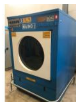
Referencia: ATG-005 SECADORA Año: 1998 Marca: MAINO