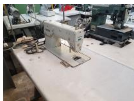
Referencia: BOR-010 MAQUINA COSER BROTHER Año: . Marca: BROTHER