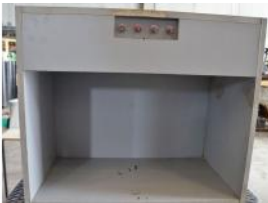
Referencia: CHS-021 CAJA DE LUCES Año: . Marca: .