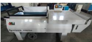
Referencia: LVG-007 EMPAQUETADORA ANGULAR Año: 2018 Marca: SIMIPACK