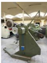
Referencia: AZC-043 DESBOBINADOR Año: . Marca: .