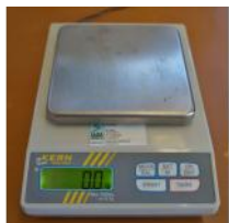
Referencia: NUT-024 BASCULA DE LABORATORIO Año: . Marca: KERN